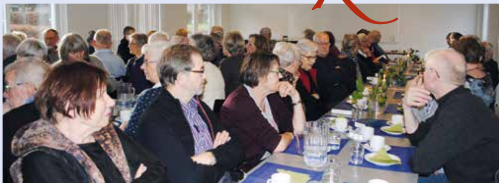
Spændende arrangementer i sognehuset, trækker ofte fulde huse.